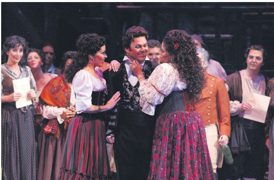
» TALENTO. Dos cantantes líricos hispanos protagonizan Carmen , la nueva obra de la Ópera de Atlanta.